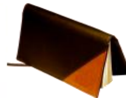
MOD. 050 AGENDA POCKET DE PIEL SINTÉTICA MOD. 060 AGENDA POCKET DE PIEL DE TERNERA MIDE 12.5 X 7 CM. IMPRESA EN PAPEL COUCHE DE 90 GRs. A UNA TINTA, CON TRES TARJETEOS, FORRADA CON TELA, LISTÓN SEPARADOR DE SATÍN Y DOS ESQUINEROS DE IMPORTACIÓN.

BELGICA NUM 920 COL. PORTALES, C.P. 03300 MEXICO D.F. TELS: 5604-5745, 56018365