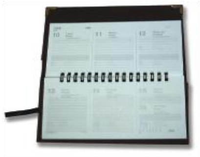
MOD. 030 AGENDA DE BOLSILLO DE PIEL SINTÉTICA MOD. 040 AGENDA DE BOLSILLO DE PIEL DE TERNERA MIDE 18 X 9 CM. IMPRESA EN PAPEL COUCHE DE 90 GRs. A UNA TINTA, CON TRES TARJETEOS, FORRADA CON TELA, LISTÓN SEPARADOR DE SATÍN Y DOS ESQUINEROS DE IMPORTACIÓN.