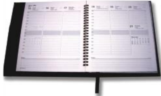
MOD. 010 AGENDA DE ESCRITORIO DE PIEL SINTÉTICA MOD. 020 AGENDA DE ESCRITORIO DE PIEL DE TERNERA MIDE 22.5 X 18 CM. IMPRESA EN PAPEL COUCHE DE 100 GRs. A UNA TINTA, CON SOLAPA Y DOS TARJETEOS, FORRADA CON TELA, LISTÓN SEPARADOR DE SATÍN Y DOS ESQUINEROS DE IMPORTACIÓN.