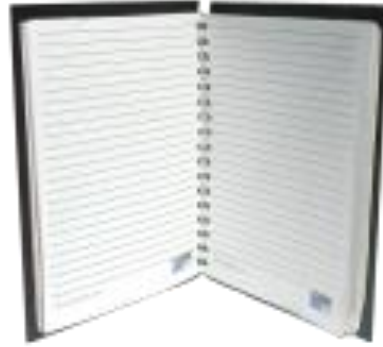
MOD. 075 CUADERNO MEDIDA 22.5 X 18.5 CUBIERTA EN PIEL SINTETICA ENCUADERNADO CON ARILLO METALICO