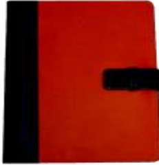
MOD. 139 CARPETA TAMAÑO CARTA FABRICADA EN PIEL SINTÉTICA MIDE: 31 CMS. X 24 CMS. CON SOLAPAS, TRES TARJETEOS, PORTAPLUMAS Y CINTURÓN.