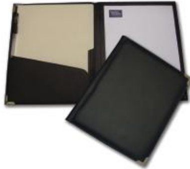
MOD. 101 DELPHOS MIDE. 31 X 24 CMS. FORRO INTERIOR EN TELA, CON SOLAPA, PORTAPLUMA Y ESQUINEROS METÁLICOS.