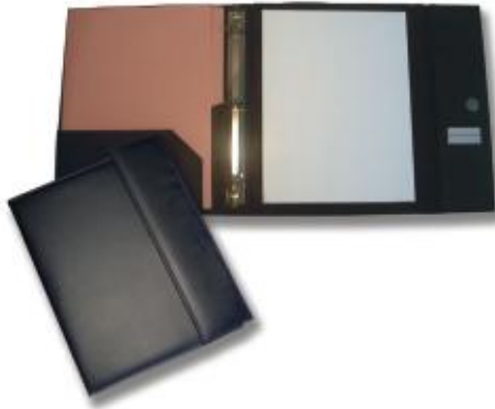
MOD. 103 TRAPER C/ TAPA MIDE. 25 X 31 CMS. CON BROCHE DE IMÁN FORRO INTERIOR DE TELA CON SOLAPA DE PIEL SINTÉTICA, 3 TARJETEOS, PORTABLOCK Y PORTAPLUMA.