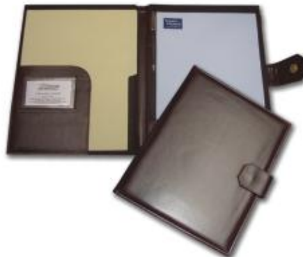
MOD. 104 BROCHE Y CINTURÓN MIDE. 31 X 24 CMS. FORRO INTERIOR DE TELA CON SOLAPA, 1 TARJETERO PORTABLOCK, PORTAPLUMA CON CINTURÓN Y BROCHE DE IMÁN.