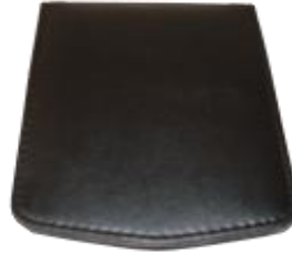
MOD. 141 CARPETA TAMAÑO CARTA VERTICAL MIDE 31 X 24 CMS. PIEL SINTÉTICA EN EXTERIOR E INTERIOR, PORTAPLUMA Y TRES TARJETEOS