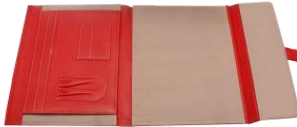
CARPETA MOD. 143 CARPETA TIPO PORTAFOLIO CON CHAPA MIDE 37 X 65 CMS. EXTENDIDA CONTIENE PORTABLOCK CON TRES COMPARTIMENTOS PARA DOCUMENTOS DOS PORTAPLUMAS DOS TARJETEOS