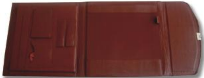
CARPETA MOD. 111

MIDE. 31 X 58 CM. EXTENDIDA. CARPETA TIPO PORTAFOLIO CON CHAPA, CONTIENE PORTA BLOCK, 3 PORTA PLUMAS, TARJETERO CON LISTÓN, PORTA PALM, PORTA CREDENCIAL Y COMPARTIMIENTO CON FUELLE.