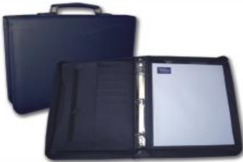
MOD.107 CARPETA PORTAFOLIO C/ASA CIERRE Y HERRAJE DE 1 PULGADA

MIDE. 26 X 34 CMS. FORRO INTERIOR DE TELA CON 3 COMPARTIMENTOS INTERIORES, 6 TARJETEROS, PORTABLOCK, PORTA PLUMA, 1 COMPARTIMENTO EXTERIOR Y CIERRE COMPLETO EXTERIOR.