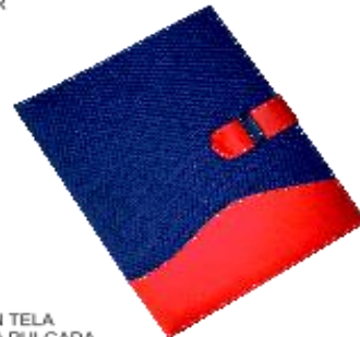
CARPETA MOD. 147 TAMAÑO 31 X 26 FORRO INTERIOR EN TELA SOLAPA, PORTAPLUMA, HERRAJE DE UNA PULGADA COMBINADA

BELGICA NUM 920 COL. PORTALES, C.P. 03300 MEXICO D.F. TELS: 5604-5745, 56018365