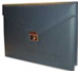
MOD. 105 TRAPER MIDE 35.5 X 28 CM. CON CHAPA Y FUELLE, 2 COMPARTIMENTOS INTERIORES.

BELGICA NUM 920 COL. PORTALES, C.P. 03300 MEXICO D.F. TELS: 5604-5745, 56018365