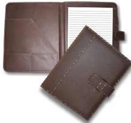
MOD. 102 DUO MIDE. 31 X 24 CMS. PIEL SINTÉTICA EN INTERIOR Y EXTERIOR, CON 2 TARJETEOS, PORTAPLUMA, CINTURÓN Y ESQUINAS REDONDEADAS.